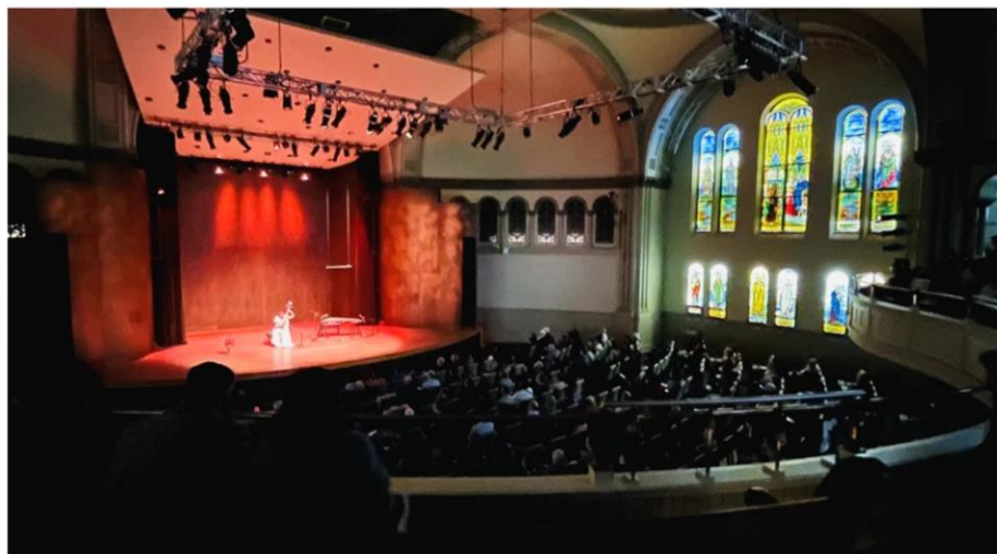
刘芳在蒙特利尔室内音乐厅 Bourgie Hall 演出 (2024)

刘芳的艺术成就得到了加拿大国家艺术委员会(Canada Council for the Arts)的高度赞赏和大力支持。多次获得加拿大国家艺术委员会奖励并得到各种赞助。2001年6月5日,刘芳荣获加拿大国家艺术委员会颁发的“青年艺术家千禧奖”(Future Generations Millennium Prize)。评审委员会认为:“