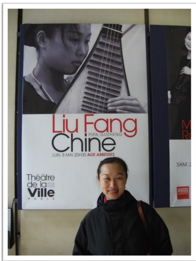
刘芳在巴黎大剧院演出，图为音乐厅里的海报

在过去近 30 年里刘芳在 33 个国家里举办了不下八百场音乐会，其中绝大多数为个人专场独奏，60-90 分钟曲目，以传统音乐的琵琶古筝音乐独奏音乐会为主。重要演出包